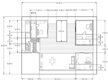
FLOOR PLAN TYPE B